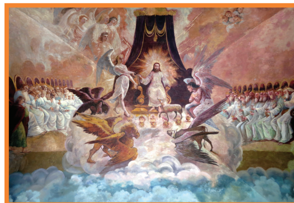
Catedral de la Purísima Concepción, Tepic, Mexico

Velo del cáliz —Es la tela (frecuentemente parecida a una vestidura) que se coloca cubriendo el cáliz.