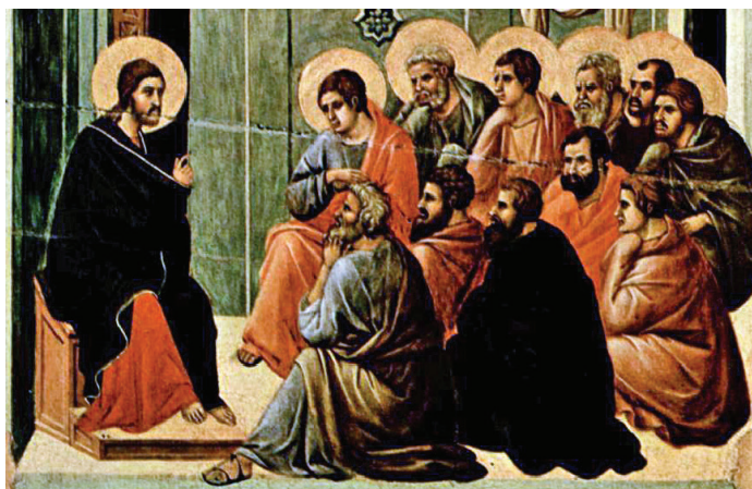
La Despedida de Cristo a Sus Apóstoles por Duccio

En la lección de hoy revisamos la conexión entre la Pascua Judía y la Última Cena. Cuando el pueblo de Israel fue esclavo en la tierra de Egipto, Dios lo liberó de la esclavitud durante el Éxodo. La Pascua sucedió en medio del Éxodo, en la noche en que Dios envió al ángel de la muerte a Egipto para matar a sus primogénitos, Dios le pidió a Israel comer pan sin levadura, sacrificar un cordero sin mancha y esparcir su sangre sobre las puertas. La sangre del cordero servía como signo de la fe del pueblo de Dios y el ángel de la muerte pasaría de largo sin hacer daño. En medio de la obra de salvación de Jesús, en una nueva Pascua llamada el Misterio Pascual, Jesús se ofreció a sí mismo como el Cordero de Dios sin mancha. En la Última Cena Jesús transformó el pan en Su propia carne y el vino en Su propia sangre, como el nuevo cordero pascual, cuya sangre nos protege de la muerte y cuya carne nos alimenta. La resurrección de Jesús nos da una nueva vida salvándonos de la esclavitud del pecado y abriéndonos una nueva tierra prometida en el cielo.