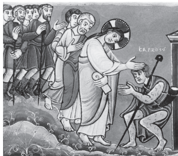
“Cristo curando a un leproso” de los Evangelios de Lorsch

También tratamos del sexto mandamiento: no cometerás adulterio ; y el séptimo: no robarás . Sobre el sexto mandamiento no entramos en los detalles del adulterio, en vez de eso les dijimos que este mandamiento protege el matrimonio y las familias y que Dios quiere que sean fieles a estas relaciones. También les dijimos que los niños deben evitar cualquier medio de comunicación que los lleve a tener malos pensamientos. A cerca del séptimo mandamiento hablamos de no tomar cosas que no nos pertenecen y cuidar las cosas que son prestadas. También conversamos sobre cómo no deben hacer trampa.