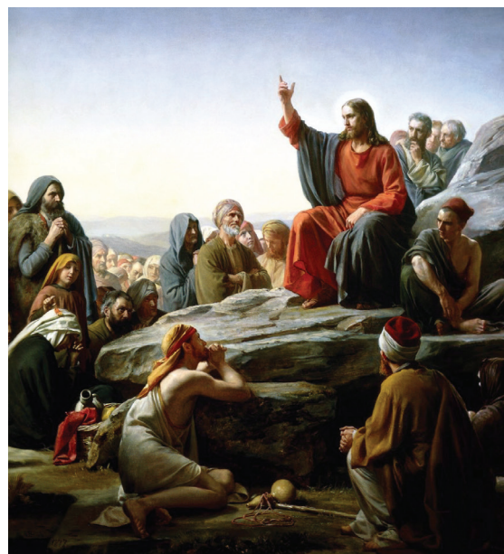
“El Sermón de la Montaña” por Karl Heinrich Bloch

Esta semana vimos como las enseñanzas de Jesús se relacionan al sacramento de la Reconciliación. Vemos una de sus parábolas, la historia de la oveja perdida: Todos los publicanos y los pecadores se acercaban a él para oírle. Los fariseos y los escribas murmuraban: “Éste acoge a los pecadores y come con ellos.” Entonces les dijo esta parábola: “¿Quién de vosotros, si tiene cien ovejas y pierde una de ellas, no deja las noventa y nueve en la estepa y va a buscar la que se perdió, hasta que la encuentra? Y cuando la encuentra, se la pone muy contento sobre los hombros. Luego, al llegar a casa, convoca a los amigos y vecinos, y les dice: ‘Alegraos conmigo, porque he hallado la oveja que se me había perdido.’ Os digo que, de igual modo, habrá más alegría en el cielo por un solo pecador que se convierta que noventa y nueve justos que no tengan necesidad de conversión” (Lc. 15, 1-7). Esta parábola nos ayuda a entender el modo en que Jesús se preocupa por nosotros y nos acerca a Él cuando nos hemos alejado y perdido por el pecado.